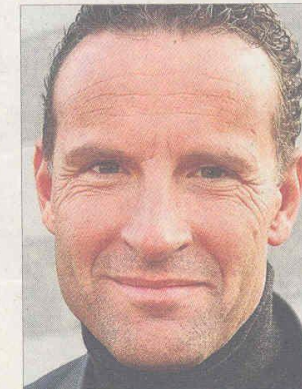
«Voll des Lobes»: Polizeisprecher